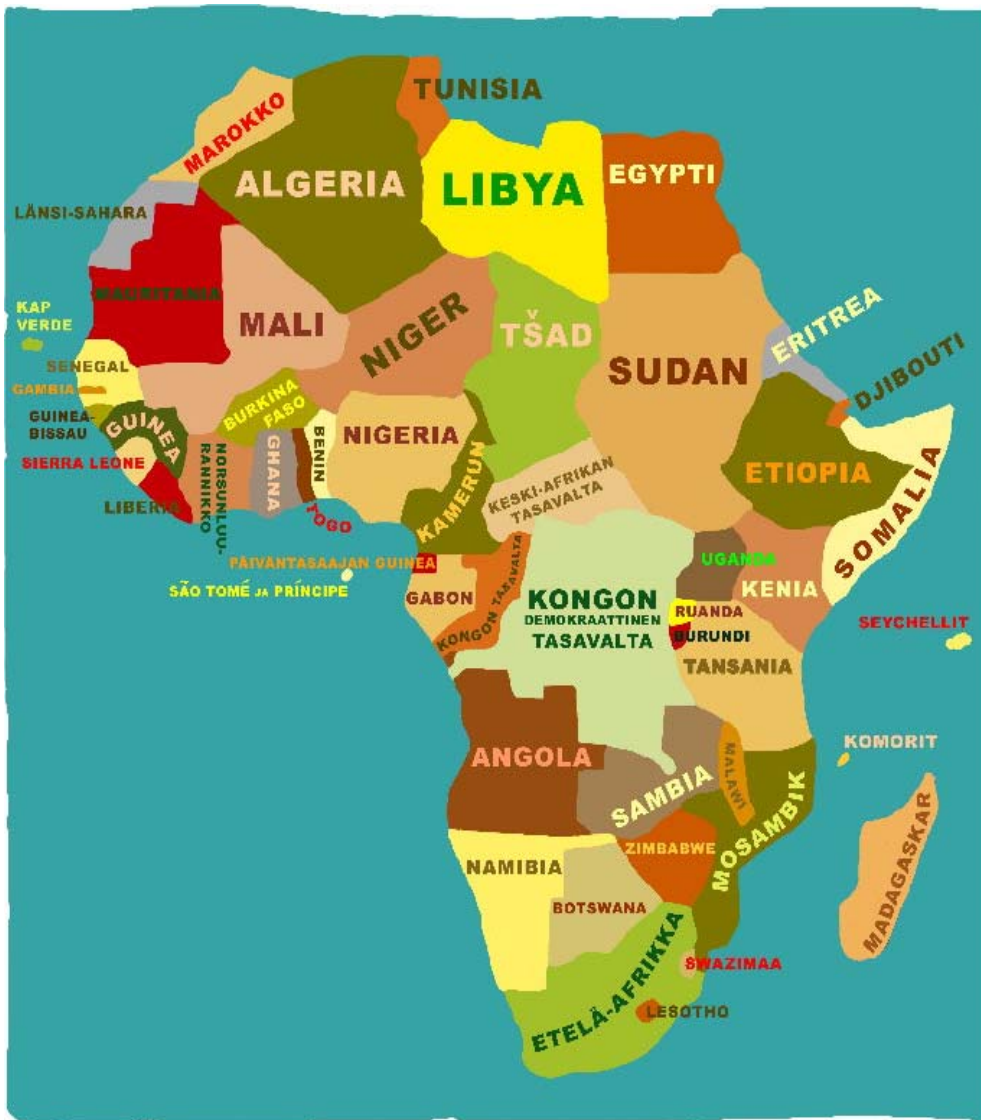
Maailmanpyörä 4/2001