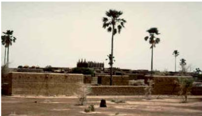
Djennen moskeija.

Ghanan kuningaskunta kävi kauppaa 1000 vuotta sitten kullalla. Valtavat karavaanit kulkivat Saharan autiomaan poikki Ghanaan vaihtamaan kankaita, mausteita ja työkaluja kultaan. Ghanalaisten kultakauppa siirtyi myöhemmin malilaisille. Nyt vuorostaan Malista tuli kauppakeskus, jossa kultaa vaihdettiin muuhun tavarahan. Kauppiaitten mukana Maliin tuli myös islamin uskonto. Djennen moskeijaan vaelsi oppineita muslimeja kaikkialta Arabiasta ja Afrikasta. Malin suuruuden aika päättyi, kun songhailaiset valloittivat malilaisten kauppapaikat. Shonghain kauppakeskus oli Timbuktu. Sinne saapui kauppiaita ja muuta väkeä halki autiomaan. Matka oli pitkä ja vaivalloinen. Vaivat palkittiin perillä Timbuktussa, jossa mausteet vaihdettiin kultaan tai taatelit kankaisiin.